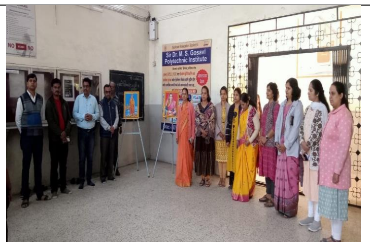
Swami Vivekananda Birth Anniversary 12.01.2022