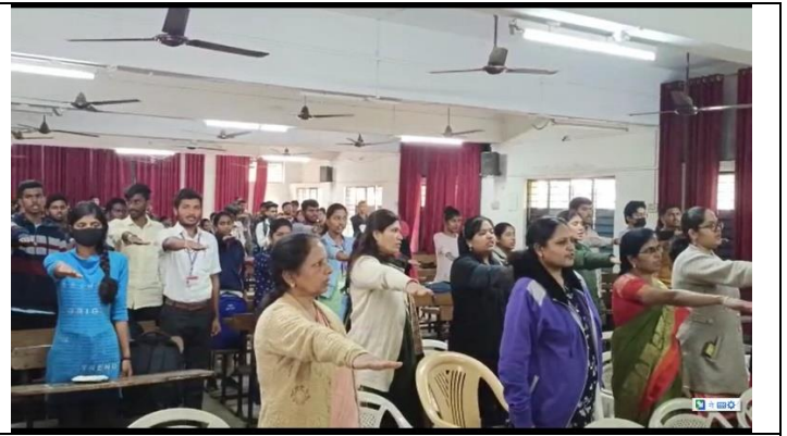
Celebration National Voters Day 25.01.2023