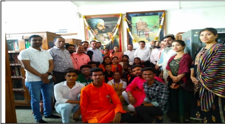
Shivaji Maharaj Birth Anniversary 19.02.2023