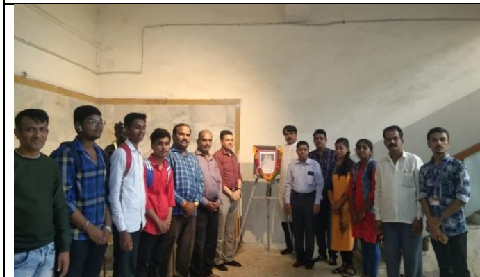
Karmveer Bhaurao Patil Birth Anniversary 22.09.2022