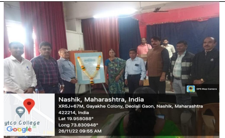
Celebrating Constitution Day of India on 26.11.2022