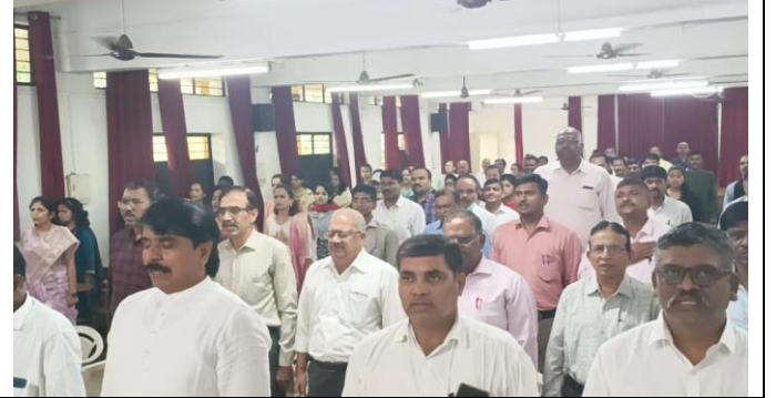
Community National Anthem 17.08.2022