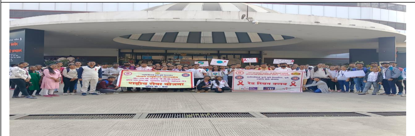
AIDS Awareness Day 01.12.2022