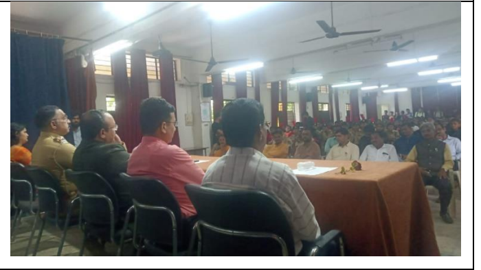
Police and Student Harmony workshop 29.09.2022