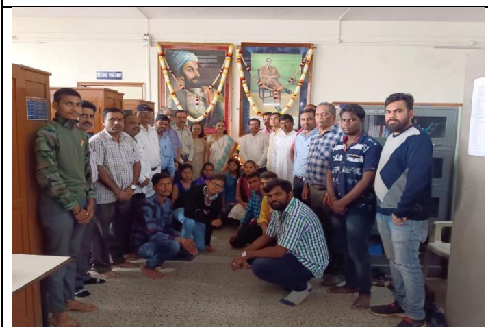
Dr. B.R. Ambedkar Death Anniversary 06.12.2022