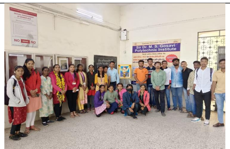
Indira Gandhi Birth Anniversary 19.11.2022