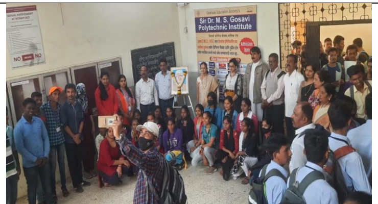
Pandit Neharu Birth Anniversary 14.11.2022