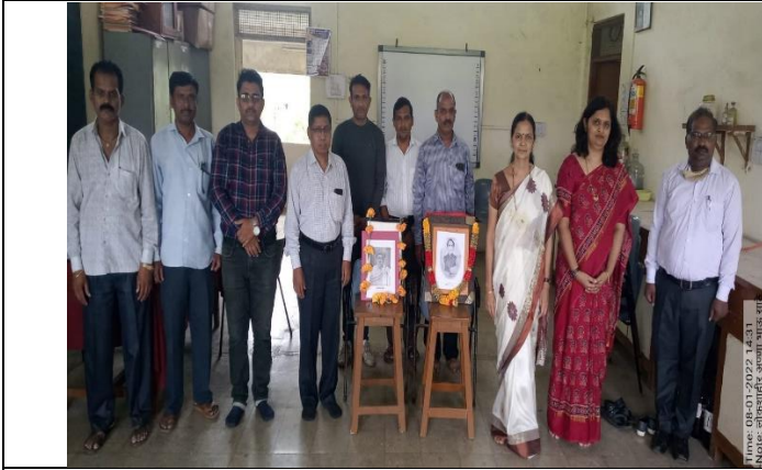
Lokmanya Tilak Birth & Annabhau Sathe Death Anniversary 01.08.2022

Title- Life work on the organising lectures occasion of Birth and Death anniversaries of Great leaders.