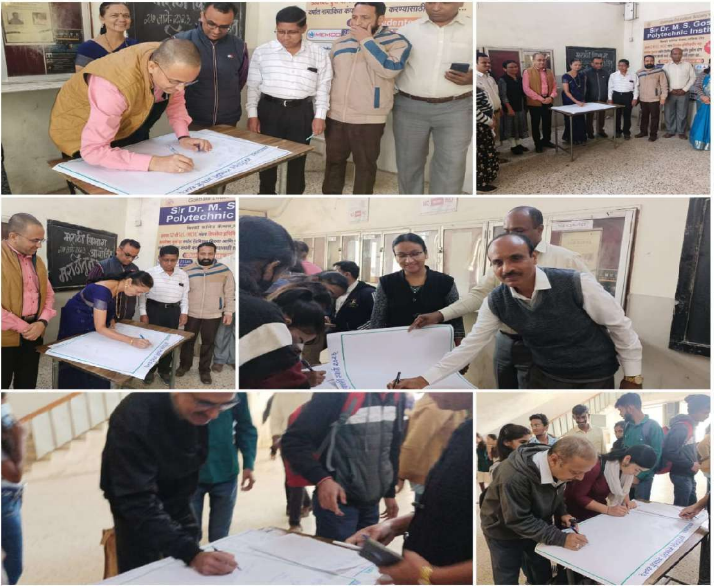
Students and Teachers actively participating in 'Best Signature in Marathi' competition